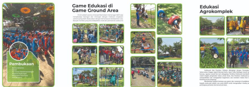
Gambar 9. Buku Profil