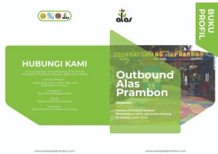
Gambar 7. Buku Profil (Dokumentasi Pribadi Kelompok, 2023)