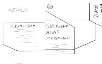
Gambar 2. Buku Profil