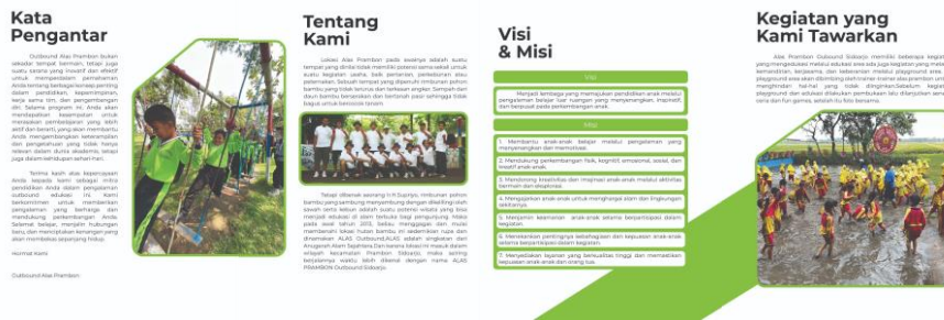
Gambar 8. Buku Profil (Dokumentasi Pribadi Kelompok, 2023)