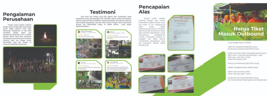
Gambar 11. Buku Profil (Dokumentasi Pribadi Kelompok, 2023)