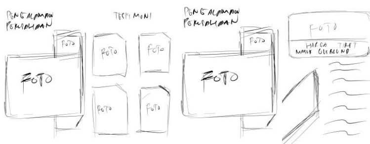
Gambar 6. Buku Profil