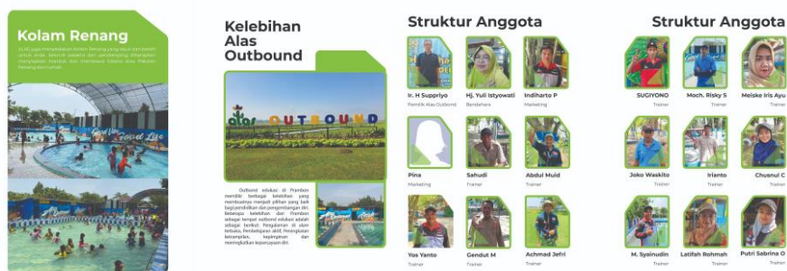
Gambar 10. Buku Profil