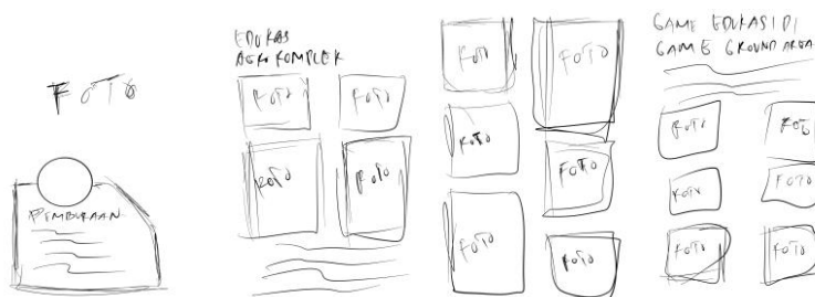
Gambar 4. Buku Profil