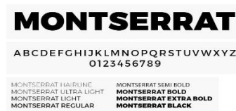
Gambar 1. Font MONTERRAT

Jenis huruf yang dipakai dalam perancangan diantaranya jenis huruf yang sesuai dengan desain yang dibuat yaitu ; monserrat, monserrat bold