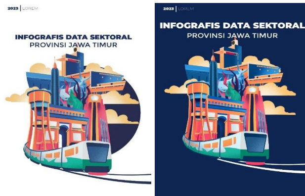
Gambar 7. 2 Cover Alternatif

Melalui tahap brainstorming dengan mencari referensi-referensi yang sesuai dengan topik pembahasan sehingga menghasilkan perancangan desain cover untuk buku Sektoral Jawa Timur Tahun 2023. Pada tahap awal perancangan yaitu pembuatan alternatif dua desain cover buku Sektoral Jawa Timur Tahun 2023. Alternatif yang disajikan masih menunjukkan perkiraan judul awal yakni Infografis Data Sektoral Provinsi Jawa Timur sebelum berganti menjadi Statistik Sektoral atau buku Sektoral Jawa Timur Tahun 2023.