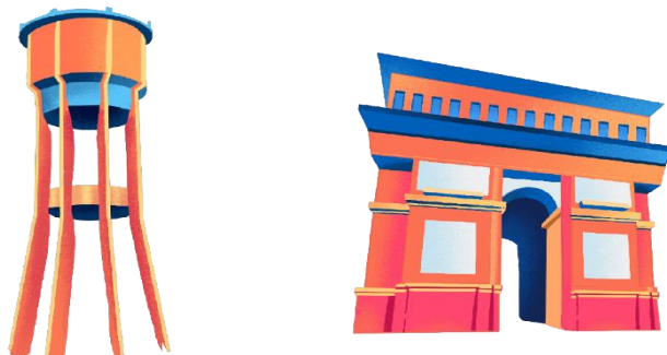
Gambar 6. Asset Bangunan Menara Air Pasuruan dan Bangunan Simpang Lima Gumul Kediri