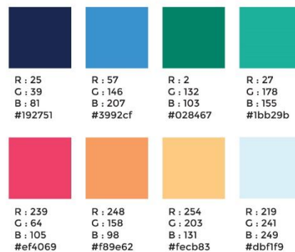
Gambar 2. Palette Warna

Karakteristik orang-orang pemerintahan yang cenderung menggunakan warna-warna yang jelas dan colorful dengan desain realistik dan tidak terlalu minimalis. Pemilihan warna dalam konteks ini dapat mencerminkan berbagai aspek seperti kepribadian, preferensi, atau bahkan budaya organisasi. Berikut adalah penggunaan warna-warna dalam buku ini: