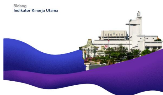
Gambar 16. Cover Halaman Bab

Pada suatu buku diperlukannya sebuah halaman indikator bab yang menjadi bagian isi buku. Dalam halaman bab ini, menampilkan masing-masing judul bab, asset fotografi sesuai tema masing-masing indikator bab, dan elemen-elemen visual pendukung lainnya.