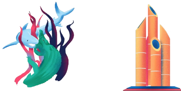
Gambar 4. Asset Monumen Patung Sura & Baya dan Monumen Bambu Runcing