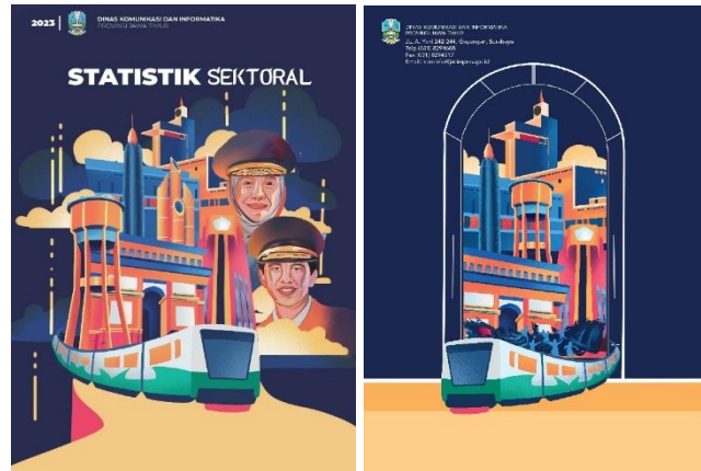
Gambar 14. Cover Depan