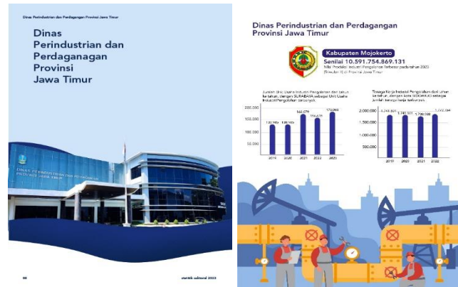
Gambar 19. Cover Halaman Sub-Bab dan Halaman Isi Highlight Infografis