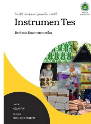
Gambar 1. Cover Instrumen Tes

Pada tahapan desain, hal yang dirancang meliputi: kisi-kisi penyusunan instrumen tes, soal tes, kunci jawaban dan pedoman penskoran. Soal tersebut dirancang berdasarkan indikator pembelajaran, materi yang dianalisis, dan indikator kemampuan pemecahan masalah. Hasil desain diberi nama prototype I. Berikut disajikan hasil pengembangan produk instrumen tes yang sudah divalidasi validator: