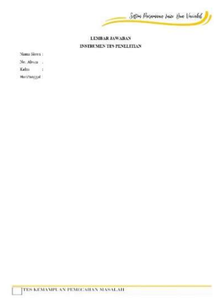
Gambar 3. Bagian Akhir Instrumen Tes