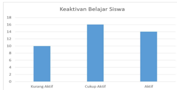
Gambar 2. Grafik Partisipasi Aktif Siswa dalam Pembelajaran

Dari data di atas yaitu data tentang keaktifan siswa dalam proses pembelajaran agar semakin jelas maka dapat dilihat pada grafik berikut :