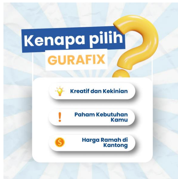
Gambar 2. Konten Feed Instagram GURAFIX

Tim GURAFIX mulai melakukan penyesuaian pada elemen desain. Penyesuaian seputar penggantian warna, gambar, dan font, agar sesuai dengan tema atau mood yang ingin disampaikan. Penyesuaian elemen ini sangat diperhatikan untuk memastikan bahwa pesan yang ingin disampaikan dapat diterima dengan baik oleh audiens.