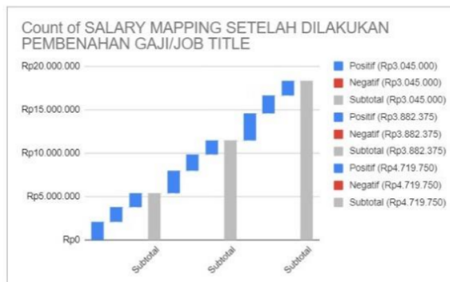
Gambar 2. Ilustrasi Sistem Kompensasi Metode Adhered (Berhimpit)