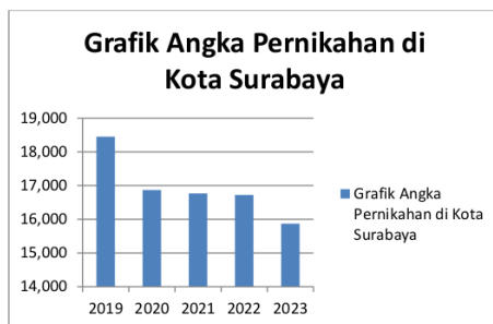
Gambar 1. Grafik Penurunan Angka Pernikahan dari Kementerian Agama Surabaya

permohonan akta perkawinan suami istri yang berbeda agama dengan landasan Undang-Undang Nomor 23 Tahun 2006 tentang administrasi kependudukan dan Putusan Pengadilan Negeri (PN) Surabaya.