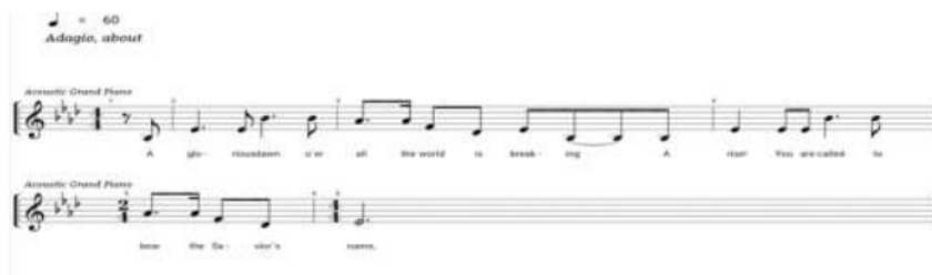
Gambar 2.: Contoh kelompok nada (motif)