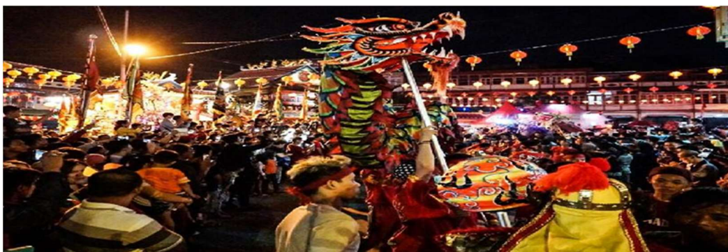
Gambar 3. Festival Cap Go Meh

Selain wisata kuliner, atraksi budaya seperti festival Cap Go Meh yang juga merupakan wisata atraksi budaya yang tidak ditemukan di tempat lain. Festival Cap Go Meh di Singkawang adalah salah satu festival terbesar dan paling terkenal di Indonesia. Festival Cap Gomeh merupakan perayaan yang meriah yang diikuti dengan parade barongsai yang megah disertai atraksi kembang api yang mengagumkan serta berbagai pertunjukan budaya. Oleh karenanya, festival ini menawarkan pengalaman yang luar biasa bagi wisatawan yang hadir. Adapun suasana perayaan festival Cap Go meh dapat ditunjukkan pada gambar sebagai berikut: