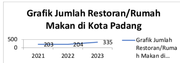
Gambar 1 Grafik Restoran /Rumah Makan di Kota Padang

Saat ini, persaingan dalam industri kuliner sangatlah ketat. Peluang usaha di industri kuliner terus berkembang, sehingga membuat bisnis di bidang ini sangat menjanjikan. Salah satu fenomena yang kita lihat adalah bertambahnya jumlah usaha kuliner. Tabel di bawah ini menunjukkan perkembangan bisnis restoran dan rumah makan yang meningkat setiap tahunnya, menurut data dari Badan Pusat Statistik Padang.