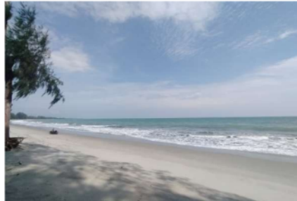
Gambar 3 tepi pantai yang bersih

“Sebagai seorang pedagang, kami selalu mengedepankan kesadaran akan kebersihan di lingkungan sekitar. Kami secara rutin mengingatkan pengunjung dan sesama pedagang tentang pentingnya menjaga kebersihan di objek wisata ini. Kami memberikan peran kepada mereka agar secara aktif terlibat dalam usaha menjaga kebersihan. Sebelumnya, kami juga telah menyampaikan usulan terkait dengan pengadaan tempat pembuangan sampah atau tong sampah di berbagai lokasi, termasuk area sekitar perapian sampah. Semua langkah ini kami lakukan dengan harapan agar semua pihak, baik pengunjung maupun pedagang, dapat berkontribusi secara bersama-sama dalam menjaga kebersihan di destinasi wisata ini. Dengan demikian, kami berharap lingkungan objek wisata tetap bersih, nyaman, dan dapat dinikmati oleh semua pengunjung.” (Hasil wawancara dengan Aidil Fitri, pedagang di Pantai Cemara Indah, 2023)