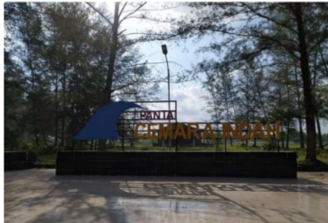
Gambar 6 Landmark Pantai Cemara Indah

sepanjang jalan atau landmark khusus, menjadi tempat favorit untuk berfoto. Kami berusaha keras agar setiap pengunjung dapat merasakan pengalaman yang unik dan menarik di destinasi wisata kami. Dengan adanya ciri khas baru ini, harapan kami adalah memperkaya pengalaman dan meninggalkan kenangan tak terlupakan bagi semua tamu yang berkunjung. ” (Hasil wawancara dengan Bapak Nizamuddin, pengelola Pantai Cemara Indah, 2023)