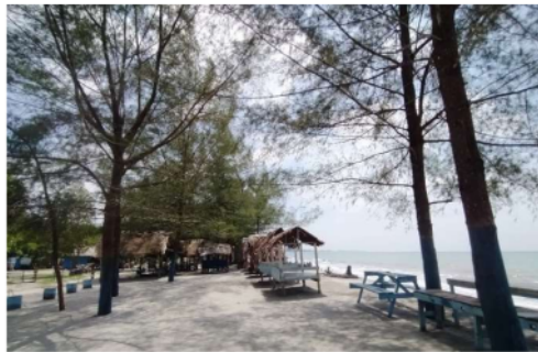
Gambar 4 Tepi pantai dengan kesejukannya

“Saat berkunjung ke Pantai Cemara Indah, saya merasakan keindahan alam yang memukau. Dikelilingi oleh pohon cemara yang memberikan kesejukan, dan suara ombak yang menenangkan, sungguh menciptakan pengalaman liburan yang tak terlupakan. Lokasi ini begitu menarik, sehingga saya merasa puas dan bersyukur bisa menjadi bagian dari keindahan alam yang luar biasa ini.” (Hasil wawancara dengan Rahmad Diva, wisatawan di Objek Wisata Pantai Cemara Indah,2023)