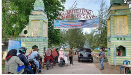
Gambar 2 Menjaga ketertiban dimulai dari pintu gerbang pantai

Sumber : 30 https://asset-2.tstatic.net/aceh/foto/bank/images/pantai-cemara-indah-gosong-telaga-singkil-utara-aceh-singkil_452022.jpg 4