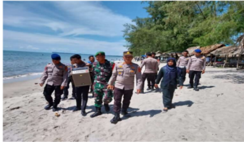
Gambar . 1 Patroli keamanan pantai

Berdasarkan hasil wawancara dengan pengelola objek wisata Pantai Cemara Indah, Bapak Nizamuddin, dapat disimpulkan bahwa keamanan pengunjung merupakan prioritas utama di tempat wisata tersebut. Sistem keamanan telah diterapkan secara luas di berbagai daerah, dengan penempatan petugas keamanan yang siap sedia. Selain itu, upaya penyuluhan kepada pengunjung tentang pentingnya keamanan juga rutin dilakukan. Dalam situasi tak terduga, seperti anak-anak yang tersesat, objek wisata ini memiliki prosedur khusus yang terhubung dengan pos keamanan. Semua tindakan ini diambil dengan tujuan agar pengunjung dapat merasa aman dan nyaman selama mengunjungi Wisata Pantai Cemara Indah.