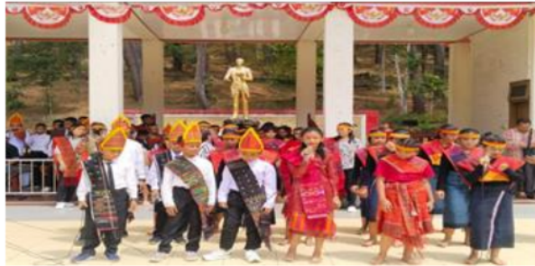
Gambar 7 : Kegiatan Akademisi di objek wisata Salib Kasih

dan keberlanjutan destinasi wisata, sambil memberikan manfaat kepada komunitas dan pengunjung.