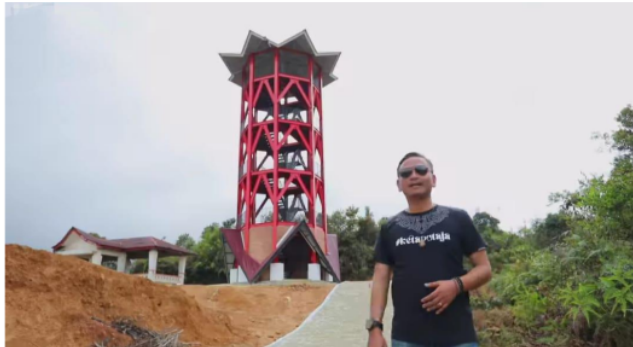
Gambar 2 : Penambahan fasilitas di kawasan salib kasih

hasil wawancara diatas maka penulis dapat menyimpulkan bahwa dinas pariwisata berupaya untuk mengupgrade destinasi wisata salib kasih dan akan memperbaiki fasilitas atau memperbaharui fasilitas yang ada agar setiap tahunnya akan ada yang baru di salib kasih untuk meningkatkan pengembangan objek wisata salib kasih yaitu pembangunan fasilitas umum, pembangunan Pusat Kreasi Destinasi Pariwisata (PKDP), pembangunan fasilitas aksesibilitas, pembangunan taman wisata olahraga dan pembangunan gedung pusat kreasi destinasi pariwisata serta pengadaan perlengkapannya.