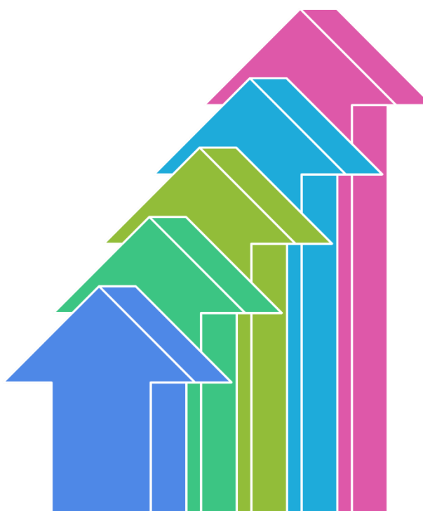
Gambar 1: Metode Penelitian Dan Pengumpulan Data