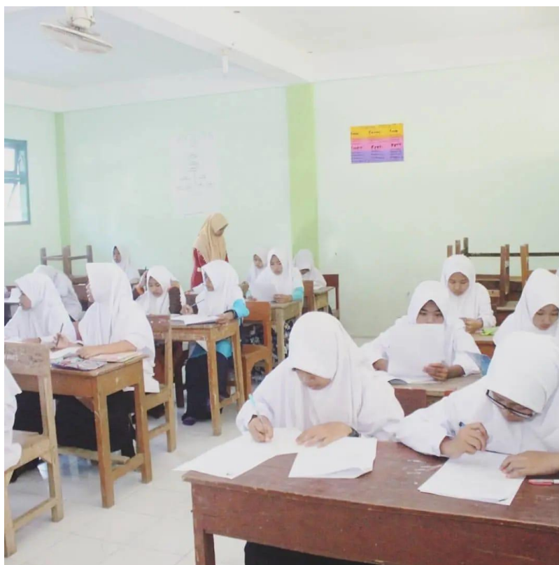
Gambar 3. Ujian Tulis Analisis Teks Pendek Dalam Maharah Qira'ah

Lebih lanjut, temuan ini juga mendukung penelitian Al-Khatib (2020) yang menyatakan bahwa pembelajaran bahasa Arab melalui teks pendek memungkinkan siswa untuk lebih fokus dalam memahami kosa kata dan struktur kalimat. Tantangan yang dihadapi, seperti keterbatasan kosa kata dan sumber ajar, juga sesuai dengan teori yang menyebutkan bahwa pengajaran bahasa harus diimbangi dengan penggunaan media yang variatif dan menarik.