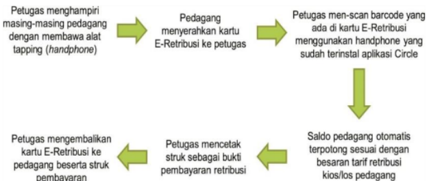
Gambar 2. Alur Pembayaran E-Retribusi Pasar