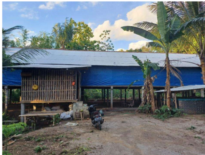
Gambar 1. Peternakan Endra

Awal mula berdirinya peternakan ini ialah dari hobi pemilik yang menyukai memelihara serta menjual belikan ayam kampung, karena ketelatannya dalam merawat ayam kampung hingga akhirnya pemilik mendapatkan sebuah tawaran untuk bekerja di peternakan ayam pedaging milik orang lain. Setelah merasa cukup untuk bekerja dengan orang lain dalam kurun waktu kurang lebih 5 tahun, akhirnya memberanikan diri untuk mendirikan peternakan sendiri bertempat di belakang rumah yang berada di Desa Kemiri Kecamatan Jenangan Kabupaten Ponorogo dan sudah beroperasi sekitar 1,5 tahun. Peternakan ini merupakan usaha yang berfokus pada budidaya ayam pedaging dengan tujuan utama menghasilkan daging ayam.