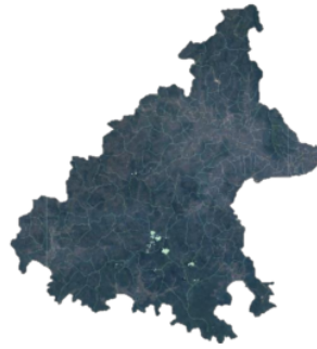
Gambar 3. Citra Landsat Tahun 2023 Komposit 432 (Analisis, 2024)