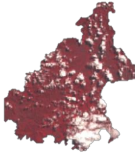
Gambar 2. Citra Landsat 8 Tahun 2023 Komposit Band 543 (Analisis, 2024)