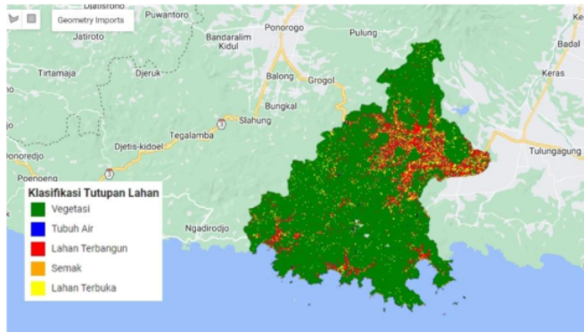
Gambar 4. Hasil Klasifikasi Penutupan Lahan (Analisis, 2024)

Gambar dibawah ini merupakan hasil klasifikasi penutupan lahan Kabupaten Trenggalek: