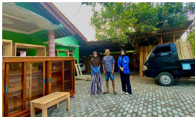
Gambar 1. Foto Bersama Pemilik Usaha

Pada tahap observasi ini penulis mengamati seperti apa proses bisnis yang dijalankan oleh UMKM Kayu Mulia Barokah. Kegiatan observasi dilakukan untuk menganalisa pencatatan transaksi keuangan yang ada pada UMKM Kayu Mulia Barokah. Berdasarkan hasil observasi, UMKM Kayu Mulia Barokah ternyata masih melakukan pencatatan secara manual di buku. Pencatatan tersebut dinilai tidak efektif dan sistematis sehingga lebih rentan mengalami kesalahan perhitungan dan akan mempengaruhi akurasi laporan keuangan UMKM Kayu Mulia Barokah.