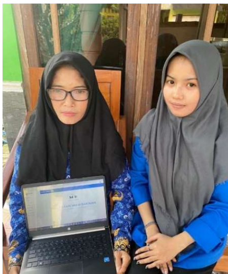
Gambar 2. Pemilik Membuat Akun Si Apik

Setelah pemilik dan penulis saling berdiskusi mengenai kendala yang dialami, penulis melakukan pelatihan pencatatan transaksi keuangan pada pemilik UMKM Kayu Mulia Barokah. Langkah pertama adalah penulis membantu pemilik usaha untuk membuka laman website SiAPIK di laptop pemilik. Setelah berhasil masuk, lalu membuat akun dan mengisi semua data informasi yang dibutuhkan. Penulis menjelaskan cara menggunakan aplikasi SiAPIK mulai dari input data transaksi hingga mendownload laporan keuangan. Setelah penulis melakukan pelatihan maka pemilik mencoba untuk melakukan input data transaksi dengan didampingi oleh penulis.