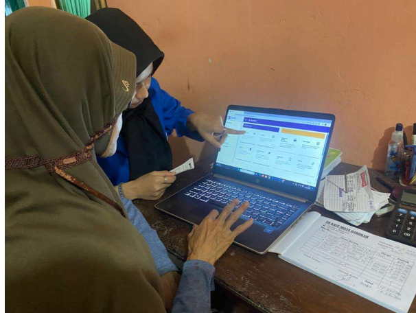
Gambar 3. Penulis Melakukan Pendampingan