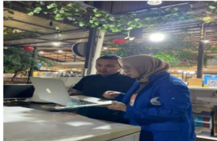
Gambar 4. Dokumentasi pertemuan ke 2 pada UMKM Kopitisi

Berikut adalah dokumentasi pertemuan kedua pada masing-masing UMKM: