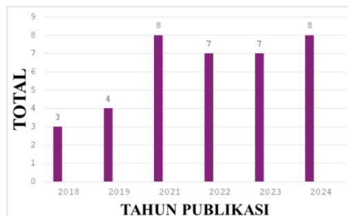
Tabel 1.2 Tahun Terbit