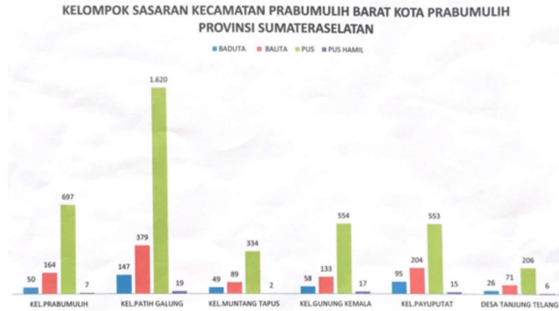
Figure 2. Kelompok Sasaran Kecamatan Prabumulih Barat

Dari gambar 2 tersebut menunjukkan data mengenai kelompok sasaran di Kecamatan Prabumulih Barat, Kota Prabumulih, Provinsi Sumatera Selatan. Kelompok sasaran tersebut dibagi menjadi beberapa kategori: Baduta (bayi di bawah dua tahun), Balita (anak di bawah lima tahun), PUS (pasangan usia subur), dan PUS hamil (pasangan usia subur yang hamil).