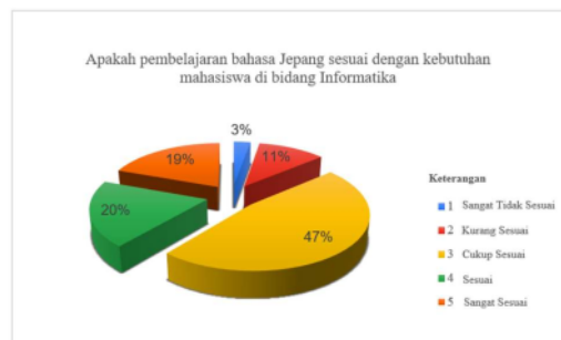
Gambar 6. Diagram Kebutuhan Bahasa Jepang untuk Mahasiswa Bidang Informatika

Diagram ini menunjukkan kesesuaian pembelajaran Bahasa Jepang dengan kebutuhan mahasiswa di bidang Informatika. Dari data yang ditampilkan, sebanyak 47% dengan jawaban 17 responden merasa bahwa pembelajaran bahasa Jepang cukup sesuai dengan kebutuhan mereka. Sebanyak 20% responden menunjukkan minat dengan memilih kategori "Sesuai" sementara 19% lainnya menganggap pembelajaran ini “Sangat Sesuai”. Sebanyak 4 responden dengan persentase 11% merasa pembelajaran bahasa Jepang kurang sesuai, dan 1 orang responden atau 3% yang menilai “Sangat Tidak Sesuai”. Ini menunjukkan bahwa mayoritas responden melihat adanya nilai dalam pembelajaran bahasa Jepang untuk mahasiswa Informatika.