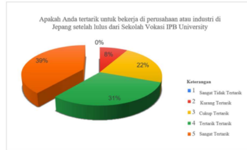
Gambar 2. Diagram Ketertarikan Mahasiswa untuk Bekerja di Jepang

Diagram di atas menunjukkan hasil survei mengenai ketertarikan mahasiswa untuk bekerja di Jepang. Diagram tersebut memiliki lima kategori yang disesuaikan pada skala likert 1-5. Dihilangkan sebanyak 14 responden dengan presentase 39% “Sangat Tertarik” untuk bekerja di perusahaan Jepang setelah lulus dari Sekolah Vokasi IPB University. Terdapat 11 responden dengan persentase 31% menjawab “Tertarik”, 8 responden sebanyak 22% menjawab “Cukup Tertarik”, 3 responden dengan hasil persentase 8% menjawab “Kurang Tertarik”, dan 0% tidak ada responden yang menjawab “Sangat Tidak Tertarik”.