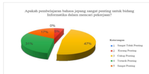
Gambar 3. Diagram Pentingnya Pembelajaran Bahasa Jepang

Sumber: Data primer yang diolah tahun 2024 menggunakan software Excel Data pada gambar diatas menunjukkan pentingnya pembelajaran Bahasa Jepang untuk bidang Informatika dalam mencari pekerjaan dengan total persentase yang sangat tinggi yaitu 95% dari 36 responden. Sebanyak 17% dengan jumlah 6 responden menganggap pembelajaran bahasa Jepang “Sangat Penting”, 31% atau 11 responden menjawab “Penting”, dan sebanyak 17 responden dengan