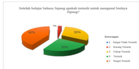
Gambar 4. Diagram Ketertarikan Mahasiswa Mengenal Budaya Jepang

Diagram ini menunjukkan bahwa sebagian besar responden yang telah belajar Bahasa Jepang memiliki minat yang cukup tinggi untuk mengenal budaya Jepang. Minat ini dapat mendorong responden untuk lebih mendalami budaya Jepang, seperti tradisi, seni, makan, dan lain sebagainya ketika akan bekerja di perusahaan Jepang. Sebanyak 42% atau 15 responden menjawab “sangat penting” untuk mengenal budaya Jepang. Terdapat 24 responden yang menjawab pada skala 3-4 yaitu “Cukup tertarik” sebanyak 30% dan “Tertarik” sebanyak 25%. Tidak ada responden yang memilih “Sangat Tidak Tertarik” pada pertanyaan kuesioner. Namun, terdapat 1 responden yang menjawab “Kurang Tertarik” untuk belajar budaya Jepang.