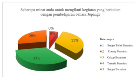
Gambar 8. Diagram Minat Mahasiswa untuk Mengikuti Kegiatan Pembelajaran Bahasa Jepang

Gambar di atas menunjukkan tingkat minat responden untuk mengikuti kegiatan yang berkaitan dengan pembelajaran bahasa Jepang. Dari data yang ditampilkan, terlihat bahwa 33% responden menganggap kegiatan tersebut cukup penting dengan jumlah responden sebanyak 12 responden, dan 33% atau 12 responden lainnya merasa kegiatan tersebut penting. Sebanyak 28% dengan jumlah 10 responden menilai kegiatan ini sangat penting, sementara 2 responden dengan persentase 6% merasa kegiatan ini kurang penting. Tidak ada responden yang menganggap kegiatan ini “Sangat Tidak Penting”, yang ditunjukkan dengan 0% pada kategori tersebut.