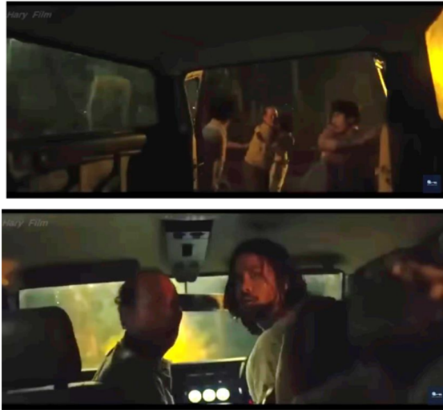
Gambar 8. Penanda dan Petanda Scene 7

Scene 7 ini berdurasi dari 1:30:00 sampai 1:31:41 dimana Ben, Jody, dan anggota keluarga Rinjani kembali ke camp Tubir untuk menyelamatkan ayah Rinjani dan masyarakat desa yang disekap. Mereka berhasil membebaskan semua tahanan di tempat itu. Setelah itu, mereka segera membawa ayah Rinjani dan yang lainnya masuk ke dalam mobil lalu melarikan diri dari camp tersebut.