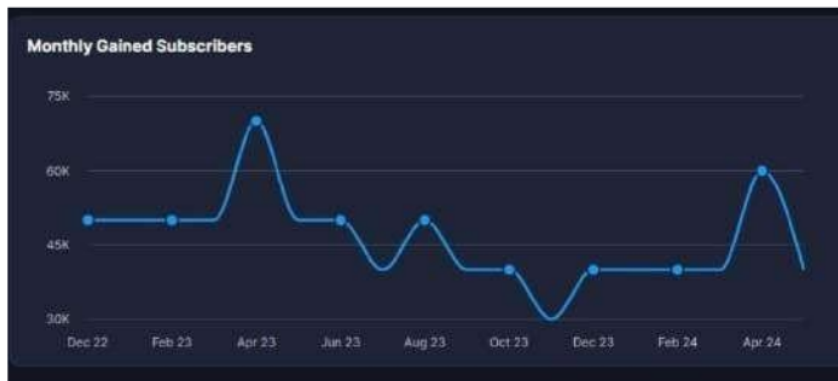
Gambar 2. Jumlah Penonton

Grafik di atas menunjukkan bahwa tontonan YouTube kedua saat ini mencapai 2.500 pengguna terbanyak pada tahun 2023. Dalam video tutorial masak Devina Hermawan, interaksi pengguna media sosial menunjukkan dinamika komunitas online. Melalui komentar, like, dan share, pengguna tidak hanya mengonsumsi konten, tetapi juga berpartisipasi aktif dalam pembelajaran dan berbagi pengalaman mereka. Dengan interaksi ini, tercipta lingkungan yang mendukung kolaborasi antar pengguna, pertukaran tips dan trik, dan mempererat hubungan antara Devina Hermawan dan pengguna lainnya.