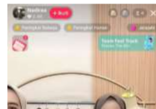
Gambar 5. Live TikTok Nadiraa