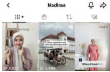
Gambar 2. Konten rekomendasi outfit