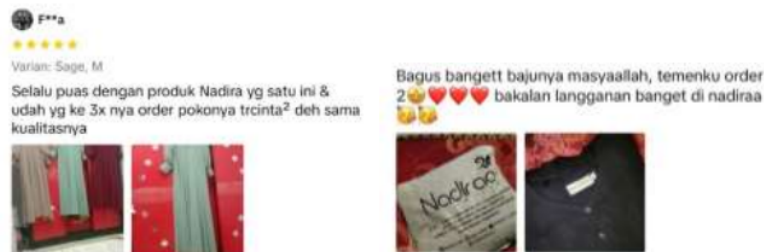
Gambar 1. Ulasan konsumen mengenai produk Nadiraa

Lalu setelah mengetahui tactic nya seperti apa, maka tahap berikutnya adalah melihat action atau tindakan yang dilakukan oleh Nadiraa di dalam memasarkan produknya di TikTok Shop. Cara-cara atau aksi yang dilakukan oleh Nadiraa adalah mempertahankan kualitas yang terbaik dan tetap konsisten dengan kualitasnya sehingga banyak dari orang-orang yang membeli produk Nadiraa merasa puas karena kualitas yang tak diragukan lagi, jahitan yang rapi bahan yang bagus serta desain yang menarik, selanjutnya Nadiraa rutin untuk mengupload konten setiap harinya seperti memberikan tips and trick tentang tutorial hijab, lalu membuat konten mengenai rekomendasi outfit yang cocok, lalu membuat konten mengenai tutorial gaya baju seperti satu baju gamis bisa dibuat menjadi dua gaya, lalu membuat inspirasi outfit daily, selanjutnya Nadiraa melakukan tindakan untuk live TikTok setiap harinya dan juga melakukan interaksi dengan konsumen dan menjawab pertanyaan dari para konsumen terkait dengan menanyakan perihal produk. Nadiraa juga memberikan link produk untuk memudahkan para konsumen untuk melihat etalase dan juga membeli produk Nadiraa.