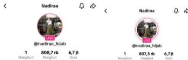
Gambar 7. Penurunan jumlah pengikut Nadiraa di TikTok