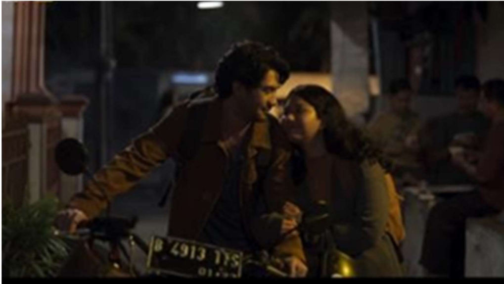
Gambar 7. Gang Perkampungan