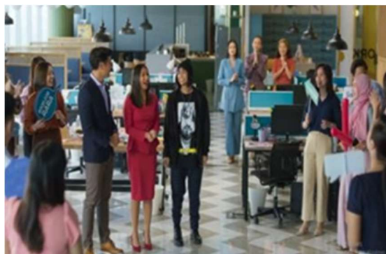
Gambar 15. Perayaan Rara Menjadi Manager Perusahaan

Interpretasi: Pada gambar ini terdapat nilai dan pesan moral, yaitu baik, positif maupun negatif, janganlah memandangi seseorang karena fisik indahnyanya dan merendahkan karena keterbatasan fisik yang dimilikinya.