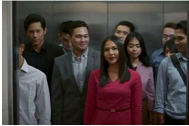
Gambar 14. Perlakuan Istimewa Rara Brada di Lift Perkantoran