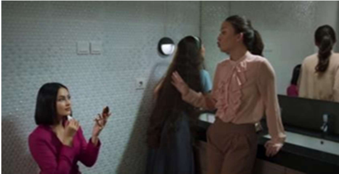
Gambar 6. Ditoilet Kantor