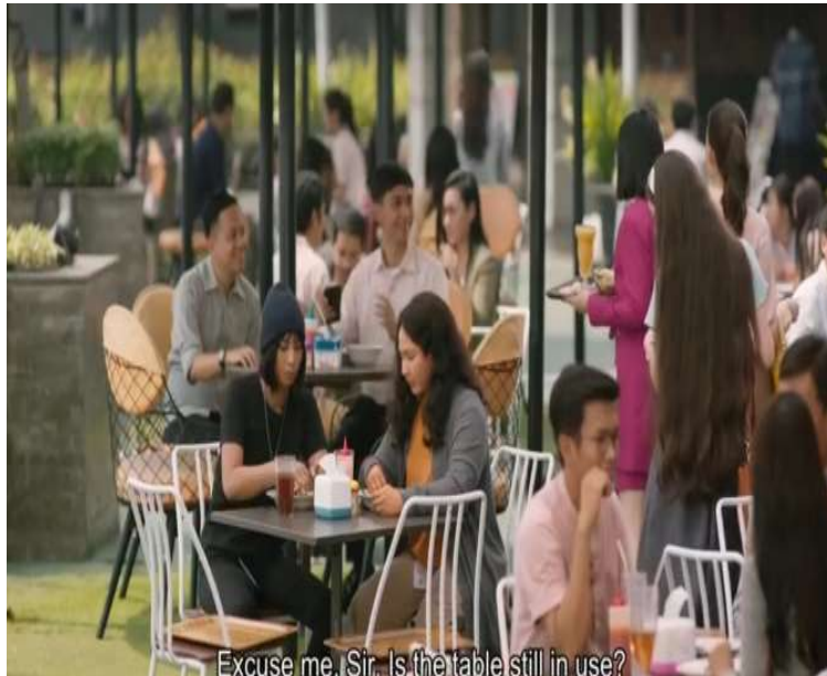
Gambar 5. Rest Areaan & Food Area