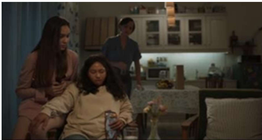
Gambar 10. DiKamar Rara

Interpretasi: Pada gambar ini terdapat pesan moral, menggambarkan sebaiknya tidak membicarakan hal buruk dibelakang orang lain.