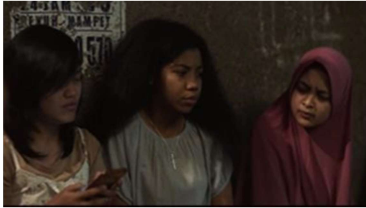
Gambar 8. Gang Perkampungan