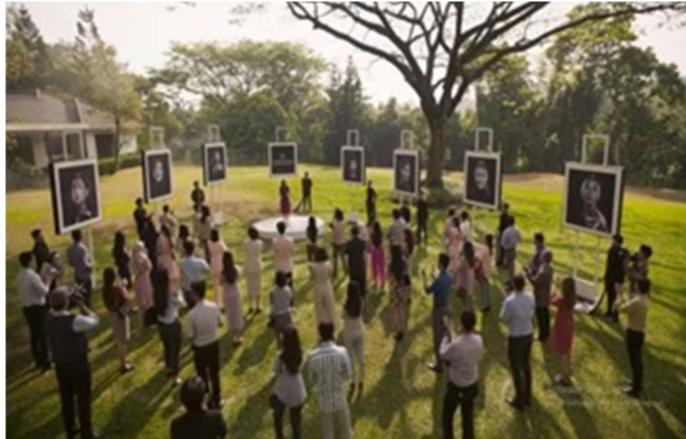
Gambar 18. Perayaan dan Launching Produk Baru Malathi