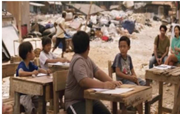
Gambar 13. Sekolah Lenteran

Interpretasi: Pada gambar ini memiliki nilai pesan moral, untuk mendapat tubuh yang ideal harus melakukan aktivitas olahraga yang tepat.