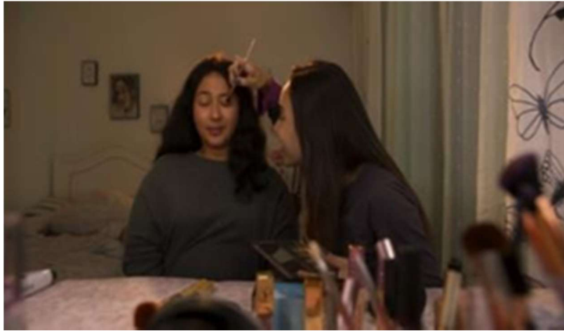
Gambar 11. Dikamar Rara