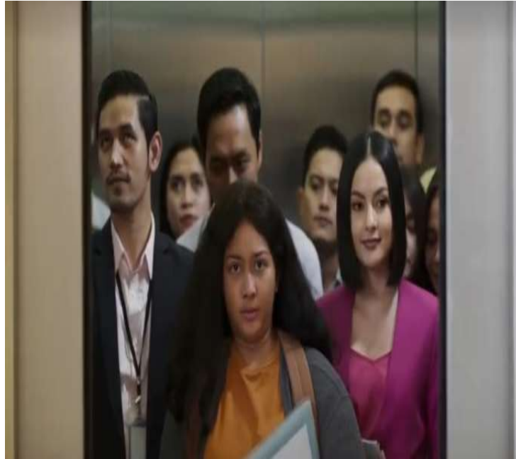
Gambar 4. Dalam Lift Perkantoran