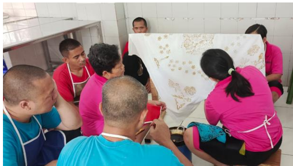
Gambar. 4 Pelaksanaan Skill Membatik Di PSBLHS3

Hasil wawancara juga menunjukkan manfaat pemberdayaan skill membatik bagi kehidupan ODGJ, yaitu kemampuan menggali potensi, mempelajari hal baru, serta meningkatkan sikap sabar, rajin, dan teliti dalam kegiatan sehari-hari. Selain itu, pemberdayaan ini juga memfasilitasi terbentuknya pertemanan yang saling membantu, bekerja sama, dan bergotong royong.