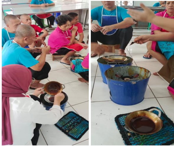
Gambar. 3 Pelaksanaan Skill Membatik Di PSBLHS3