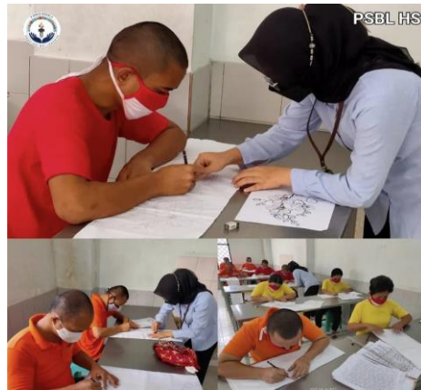
Gambar. 2 Kondisi Pelaksanaan Skill Membatik Di PSBLHS3

Pentingnya pemberdayaan keterampilan membatik juga tercermin dari kesempatan yang diberikan kepada warga binaan sosial untuk menyumbangkan ide-ide pola batik mereka sendiri, sehingga mendorong kemandirian dan kreativitas mereka.